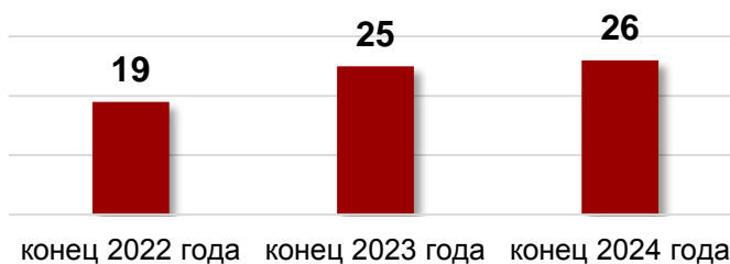
ДИНАМИКА КОЛИЧЕСТВА ПРЕДПРИНИМАТЕЛЕЙ В ГОРОДЕ НОРИЛЬСКЕ, ПОЛУЧИВШИХ СТАТУС РЕЗИДЕНТОВ АЗРФ ЗА 2022-2024 ГГ., шт.

Дополнительно ознакомиться с информацией о мерах поддержки можно на официальном сайте АНО «Агентство развития Норильска»